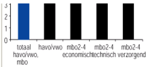
Figuur 2. Gemiddelde baanzoekduur van mbo/havo/vwo-ers naar richting, 1999-2001, in maanden