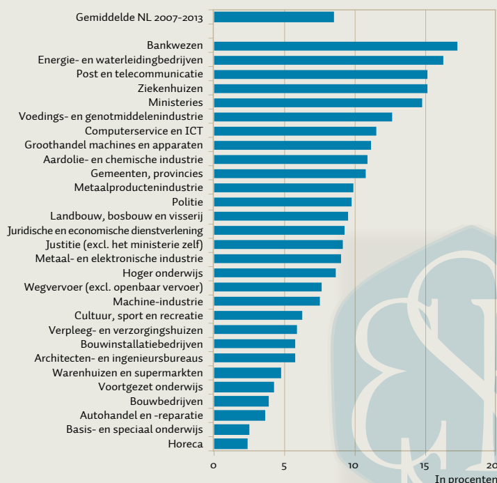
1 Aandeel werknemers dat in de afgelopen twaalf maanden te maken had met bedrijfsautomatisering, gemiddeld over de periode 2007-2013.