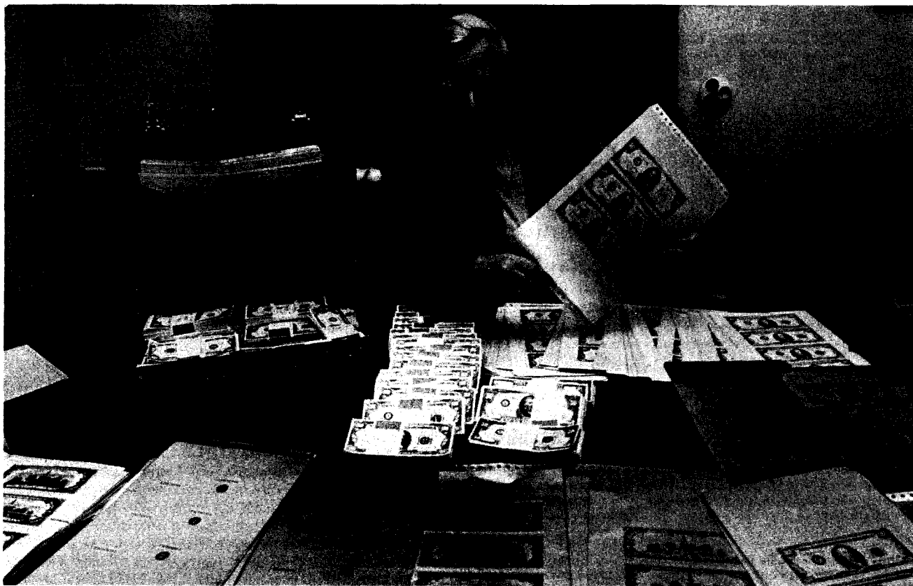
Valse dollarbiljetten, die in januari dit jaar in Sleeswijk-Holstein werden ontdekt.

de Nederlandsche Bank op haar bankbiljetten heeft erkend, staat dit recht op de biljetten vermeld. Tot 24 augustus 1982 verbood de Bank elke reproductie die maar enige gelijkheid met een bankbiljet vertoonde. Mede gezien het feit dat afbeeldingen van bankbiljetten een geliefd object voor publiciteitsdoeleinden vormen, is men tegenwoordig bereid reproductie onder bepaalde voorwaarden toe te staan. De voornaamste bepalingen 17) zijn dat de reproducties qua kleur en afmetingen aanzienlijk van de originele bankbiljetten moeten verschillen en het nagemaakte bankbiljet éénzijdig wordt afgedrukt. De maximale straf wegens een opzettelijke inbreuk op het auteursrecht van de Bank bedraagt zes maanden gevangenisstraf of een geldboete van f. 25.000 (art. 31).