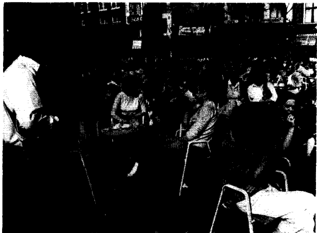
Seizoenwerkers en seizoenwerklozen

ligt. Voor nWW-gerechtigde uitzendkrachten bestaat voor minder dan de helft van de gevallen na het eerste half jaar recht op continuering van de uitkering.