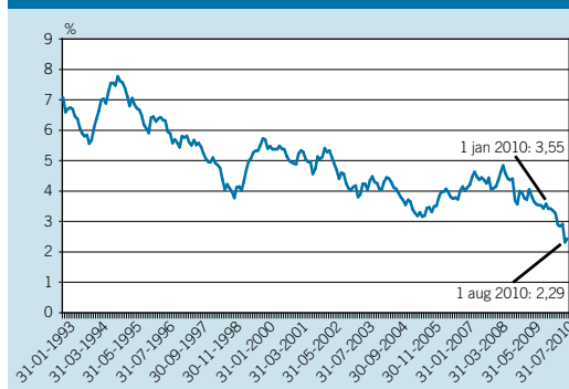
Renteontwikkeling, tienjaars leningen Nederland (in procenten).

keerzijde van een dalende rente is dat het een lagere verdisconteringsvoet betekent waardoor de waarde van toekomstige verplichtingen toeneemt. Dit heeft met name negatieve gevolgen voor Nederlandse pensioenfondsen die geconfronteerd worden met een hogere toekomstige verplichting ten opzichte van de huidige waarde van de beleggingen.