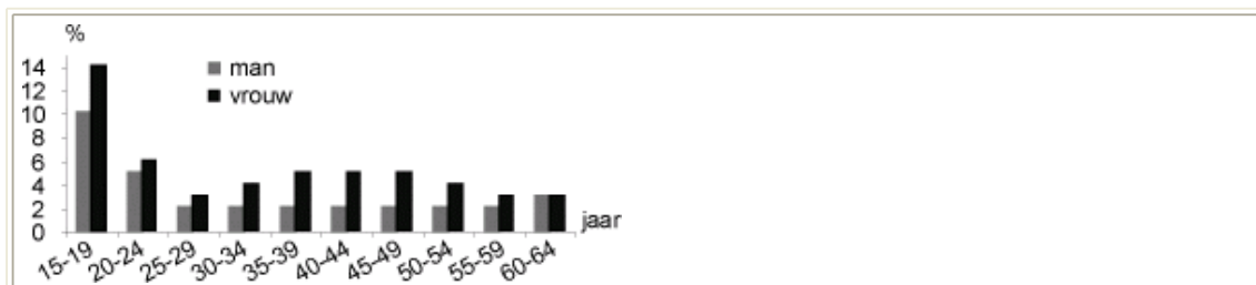
Figuur 3. Werkloze beroepsbevolking van 15-64 jaar in 2001, in procenten van de beroepsbevolking naar geslacht