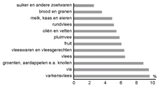
Figuur 2. Prijsstijging van voedingsmiddelen en alcoholvrije dranken, procentuele mutatie eerste kwartaal 2001 t.o.v. eertse kwartaal 2000