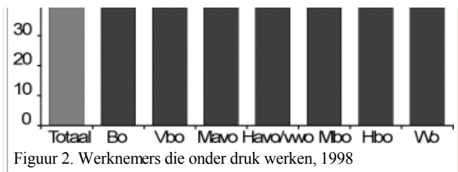
Figuur 2. Werknemers die onder druk werken, 1998