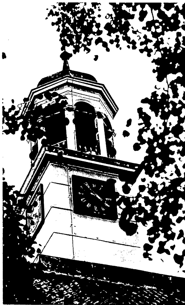
Assen: toren provinciehuis

Het beleid voor Finisterre werpt Alonso tegen dat het niet stoelt op een concreet en gespecificeerd actieprogramma voor verdere ontwikkeling der economische activiteiten. Er is hooguit sprake van goede bedoelingen, in diversiteit gegroeid en in feite het resultaat van brain-storming. De vage verwachtingen ten aanzien van de mogelijke groei in bepaalde bedrijfsklassen steunen niet op praktisch inzicht in de vestigingsplaatsproblematiek en op commercialiteit. Een voor sommige bedrijfsklassen belangrijke factor als de levering van goedkope energie (noch in Finisterre, noch in Noord-Nederland het geval) krijgt te weinig aandacht. Zaken die belangrijk worden geacht, zijn dat meestal niet voor derden, omdat dergelijke vestigingsplaatsfactoren al in meer dan voldoende mate in meer dan voldoende regio's beschikbaar zijn. Een unieke regio-eigen factor (evt. te creëren: goedkope energie) wordt te weinig benut. Soms wordt een verwachting op een wel heel vreemde activiteit gebaseerd (in Finisterre: de impuls van de militaire sector, waarvan de verdere uitbouw allerwegen in Westeuropa op de tocht staat — vgl. het oefenterrein bij Ter Apell).