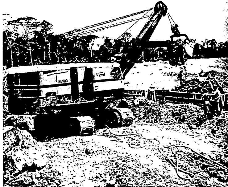
...overweldigende belang van bauxiet...

De stijgende welvaart in Suriname heeft een aanmerkelijke verschuiving in het consumptiepatroon bewerkstelligd, waardoor het aandeel van de primaire levensbehoeften is afgenomen en dat van de secundaire levensbehoeften is toegenomen. Het zijn echter juist deze goederen en diensten die de laatste jaren een progressieve prijsstijging