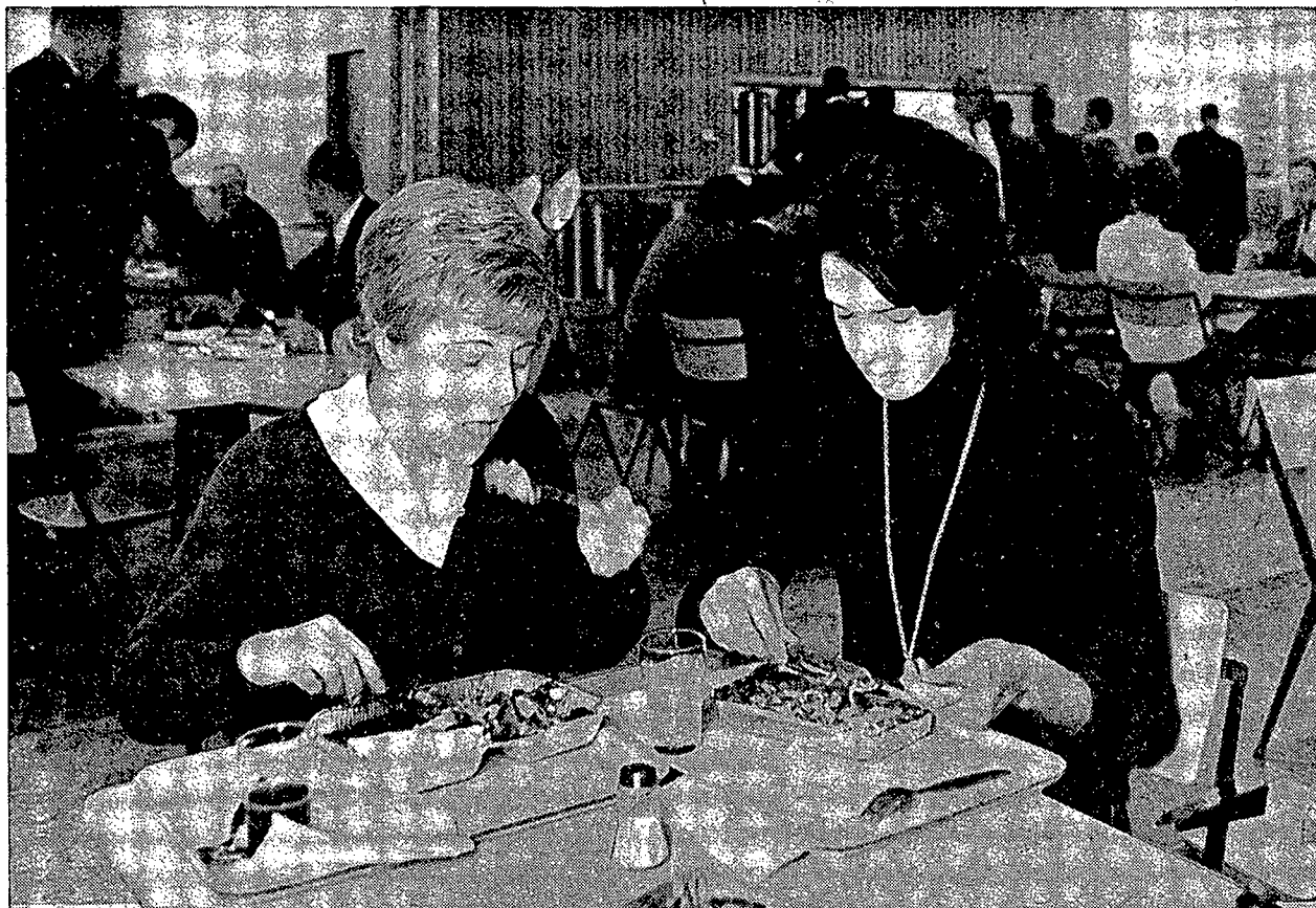
Cantine Staatsdrukkerij 's-Gravenhage