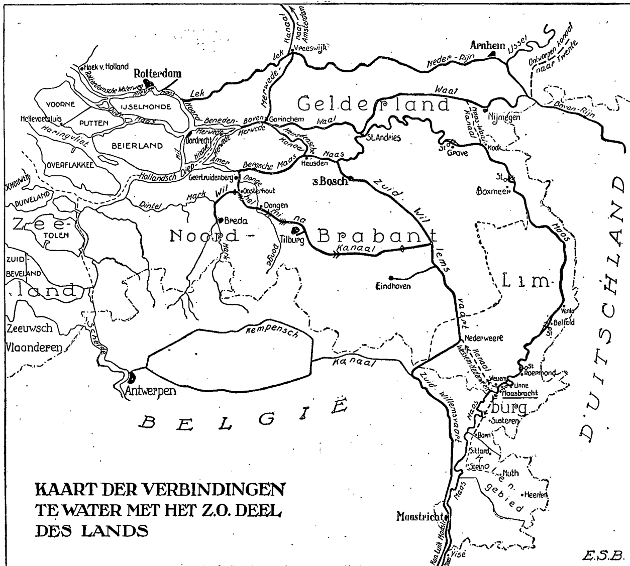
KAART DER VERBINDINGEN TE WATER MET HET Z.O. DEEL DES LANDS

Al had het belangrijkste verkeer langs de Zuid-Willemsvaart plaats, de Maas werd niet geheel vergeten; deze werd voortdurend verbeterd, zoodat thans beneden Venlo een diepte van 3 M. onder M. R. (middelbare rivierstand) aanwezig is. Gedurende langen tijd van het jaar is echter de waterstand op de Maas beneden M. R.; in het droge jaar 1911 daalde het peil zelfs tot 1.54 onder M. R. te Venlo. Boven Venlo is de toestand voor de vaart slecht en in hoofd-