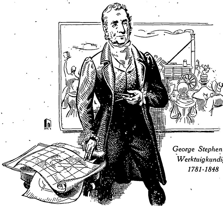
George Stephenson Werktuigkundige 1781-1848

VAN DE VONK DIE STERKER IS DAN 100.000 VOLT