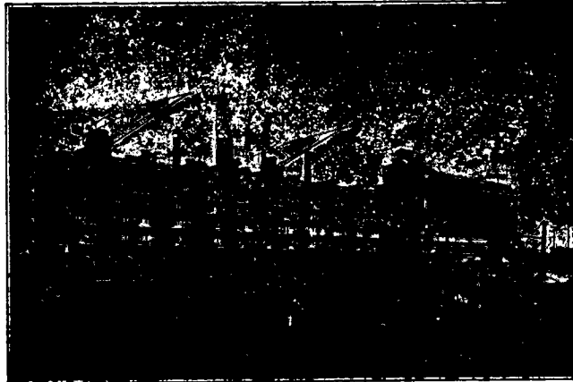
PAKHUIS EN SILO-GEBOUW „ST. JOB”, ROTTERDAM BEËEDIGDE WEGERS EN METERS