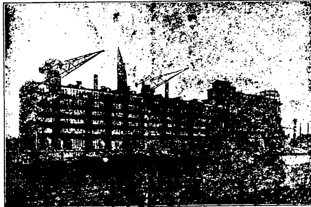
PAKHUIS EN SILO-GEBOUW „ST. JOB”, ROTTERDAM BEËDIGDE WEGERS EN METERS