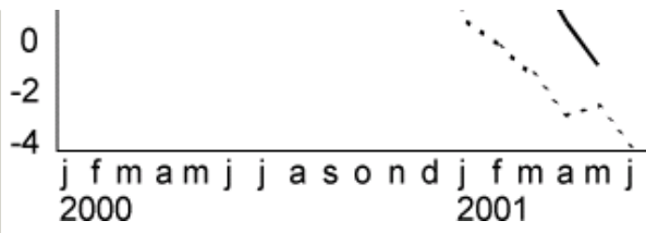
Figuur 2. Productievolume industrie, procentuele mutaties t.o.v. dezelfde maand voorgaand jaar