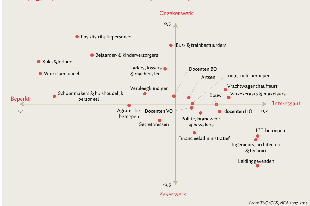
Beroepsgroepen en de kwaliteit van werk (n =226.299) FIGUUR 2

Ten slotte zien we dat niet-westerse allochtonen op belangrijke werkkenmerken ongunstiger scoren dan autochtonen of westerse allochtonen. Niet-westerse allochtonen werken – in vergelijking met autochtonen – meer in tijdelijke banen met meer baanonzekerheid. De verschillen zijn niet groot maar wel significant. En daarnaast blijkt onder meer