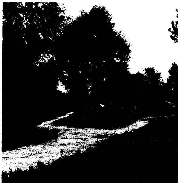
Meerjarenprogramma: wel geld voor aankoop, geen geld voor beheer

Jaarlijks zullen tussen de 10 à 20 gebieden aangewezen worden als staatsnatuurmonument . Deze aanwijzing (eigendom van de staat) lijkt geen financiële gevolgen voor de begroting van de komende jaren te hebben. Voor natuurmonumenten die eigendom zijn van particulieren,