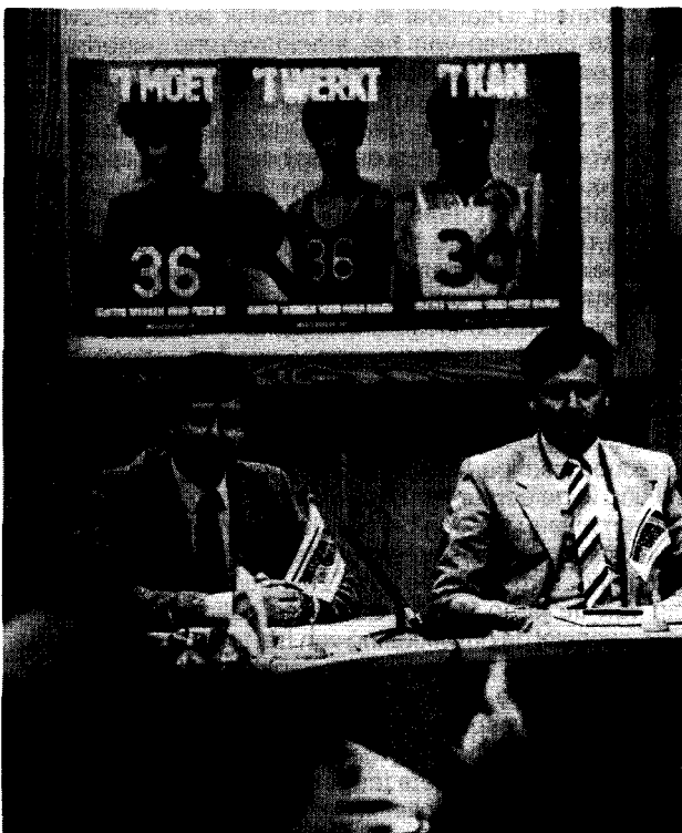
36 uur: 't moet, 't werkt, 't kan, ook al staat het niet in het centrale plan.

men mag aannemen ook de koopkrachtontwikkeling. Voor het overige overheersen de verschillen. Bij loonmatiging neemt het arbeidsvolume extra toe en na verloop van tijd ook de productie. Bij adv nemen zowel het arbeidsvolume als de productie structureel af ten opzichte van de basisprojectie. Het financieringssaldo van de overheid verbetert iets bij loonmatiging en verslechtert iets bij adv, hetgeen ongetwijfeld zal samenhangen met de hoge herbezettingsgraad bij de overheid.