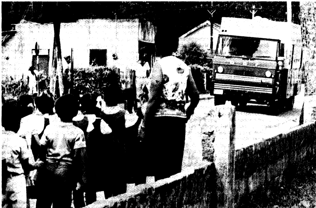
Wie is het meest gebaat bij ontwikkelingshulp?

Het effect van binding hangt ook af van de mate waarin gebonden hulp wordt gebruikt als substituuut voor andere manieren om handelsstromen naar ontwikkelingslanden te financieren. Indien een ontvangend land zowel goederen op commerciële basis importeert of wenst te importeren uit een donorland als deze via hulp verkrijgt, kan de ontvanger gemakkelijk de hulpfondsen gebruiken ter financiering van de voorheen zelf gefinancierde benodigde import uit het donorland. De via de hulp verkregen koopkracht kan dan door de ontvanger naar believen worden besteed. Ook is het mogelijk dat in de onderhandelingen met de donor wordt bewerkstelligd dat juist die goederen en diensten in het kader van hulpprogramma's worden geleverd die het ontvangende land anders zelf zou hebben verworven. Ook dan is sprake van substitutie en draagt de donor in wezen koopkracht over die door de ontvanger kan worden besteed op een wijze en bij een leverancier