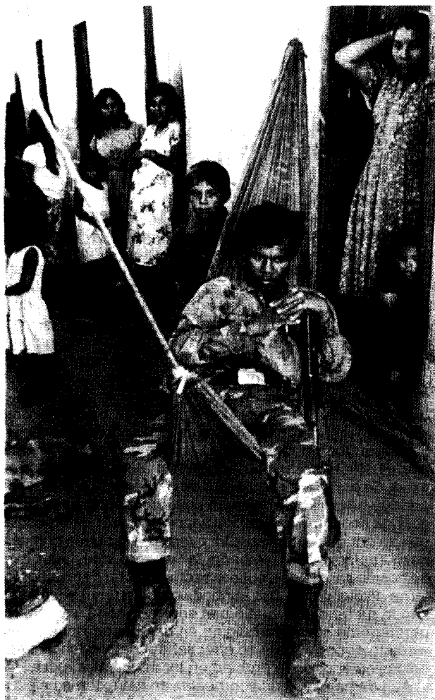
De Nicaraguaanse economie buigt door onder de zware last van de defensie-inspanning.

den dient te worden: de verhouding tussen de collectieve en de particuliere sector. Morawetz behandelt namelijk twee instrumenten voor een herverdelingsbeleid: nationalisaties en loonsverhogingen.