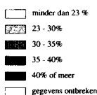
Den Haag, percentage inkomensontvangers 15 - 64 jaar met uitkering

Het kartogram laat van het aandeel niet-actieven per buurt van Den Haag – met alle beperkingen van dien – een beeld zien van de maatschappelijke segmentatie aldaar. Van de 15- tot 65-jarigen met een inkomen is gemiddeld 30% niet-actief. Dit is 8 procent-punten boven het landelijk gemiddelde (22%). De concentratie uitkerings-ontvangers is het grootst in de Schildersbuurt, het Transvaalkwartier en enkele omliggende buurten.