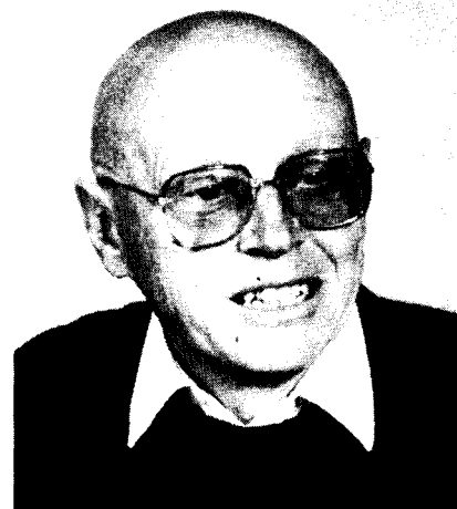
G. Hofstede, de nieuwe nummer één

heeft hij zich op dit terrein grote internationale faam verworven. Met 431 citaties staat hij eenzaam aan de nationale top (zie tabel 1). Daarnaast is er een tweede, nieuwe naam in de top van de ranglijst. Na Tinbergen, op nummer twee, verschijnt daar S. van Wijnbergen. Van Wijnbergen is een Nederlandse econoom die een jaar of tien geleden naar de Wereldbank is vertrokken en daar met talrijke internationale publicaties naam heeft gemaakt. Onlangs heeft hij zijn baan bij de Wereldbank echter verruild voor een leerstoel aan de Universiteit van Amsterdam. Met 178 citaties verzekert hij zich van een stevige derde plaats. Tegenover terugkeer van talent staat vertrek. De nummer twee van vorig jaar, A.P. Barten, is na enkele jaren het directeurschap te hebben bekleed van het CentER van de KU Brabant, weer full-time teruggekeerd naar Leuven, waar hij sinds jaar en dag aan de Katholieke Universiteit doceert. Daarmee verdwijnt hij uit de Nederlandse top-30.