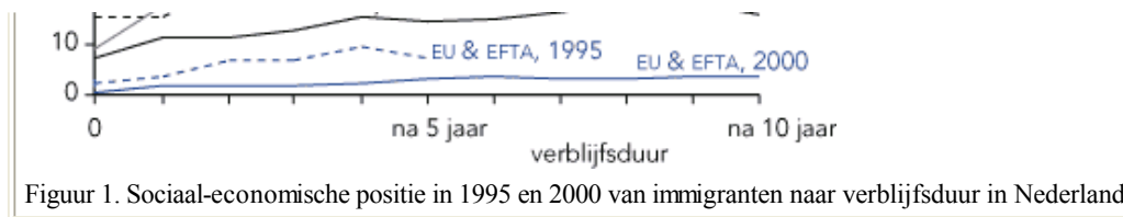
Figuur 1. Sociaal-economische positie in 1995 en 2000 van immigranten naar verblijfsduur in Nederland