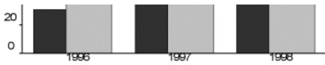
Figuur 2. Banen van werknemers, jaargemiddelden, mutatie t.o.v. voorgaand jaar x 1000