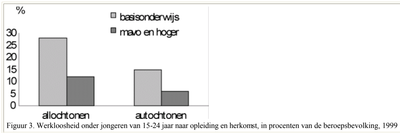
Figuur 3. Werkloosheid onder jongeren van 15-24 jaar naar opleiding en herkomst, in procenten van de beroepsbevolking, 1999